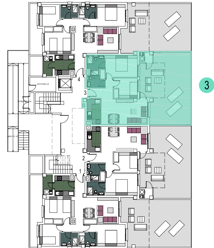
(PLANTA BAJA )